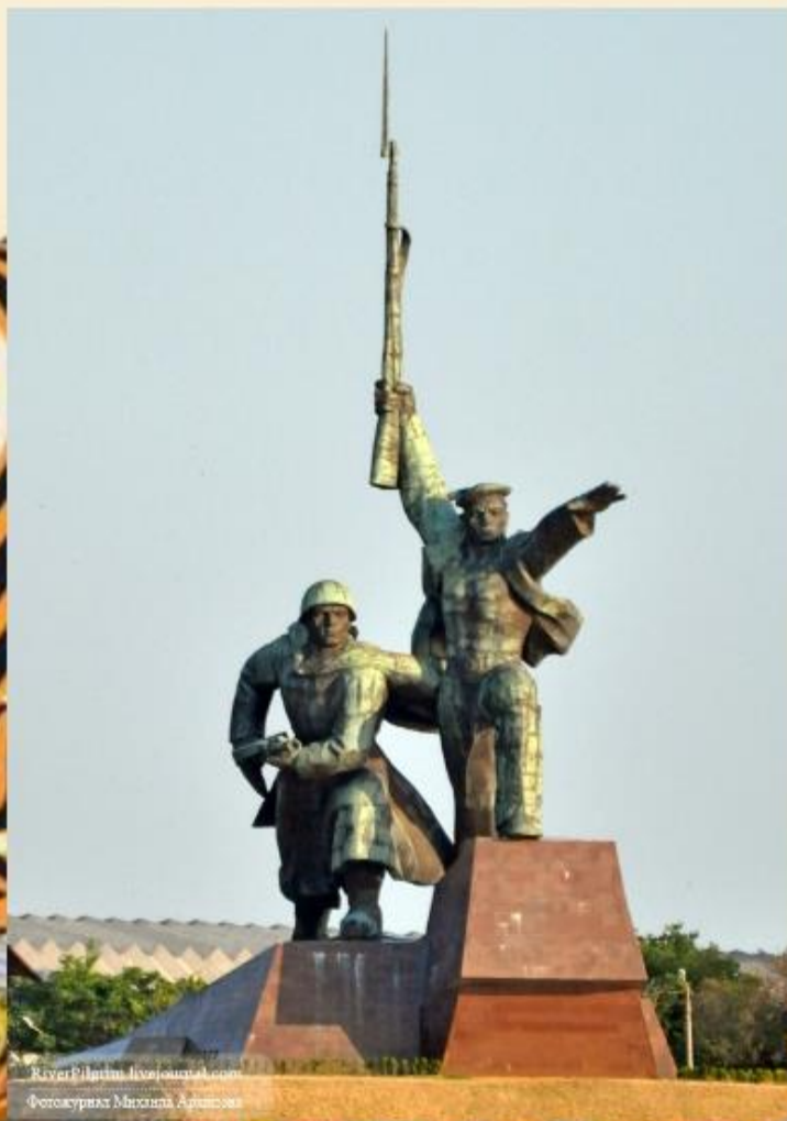
РиверФлитин. Фотограф Михаил Адишова

Суровым и тяжелейшим испытанием для севастопольцев и моряков Черноморского флота стала