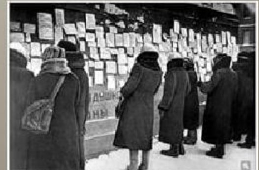
8 дней блокады Ленинграда. Объявление об обмене вещей на продукты. 1942