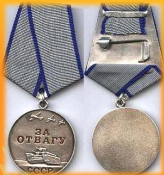
Медаль за отвагу

За героизм и подвиги на войне, солдаты награждались орденами и медалями.