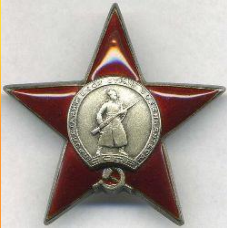
Орден красной звезды