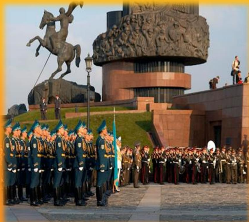
Поклонная гора в Москве