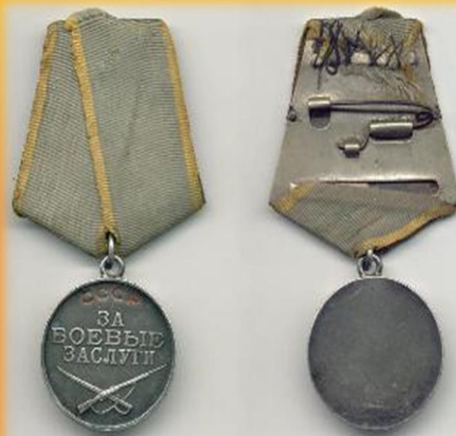
Медаль за боевые заслуги