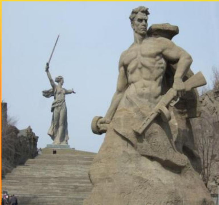
Мамаев Курган в Волгограде Монумент-