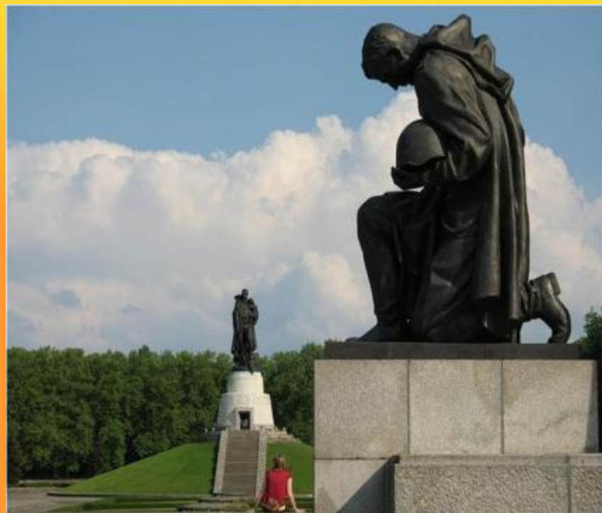
Памятник воинам Советской Армии павшим в боях с фашизмом.