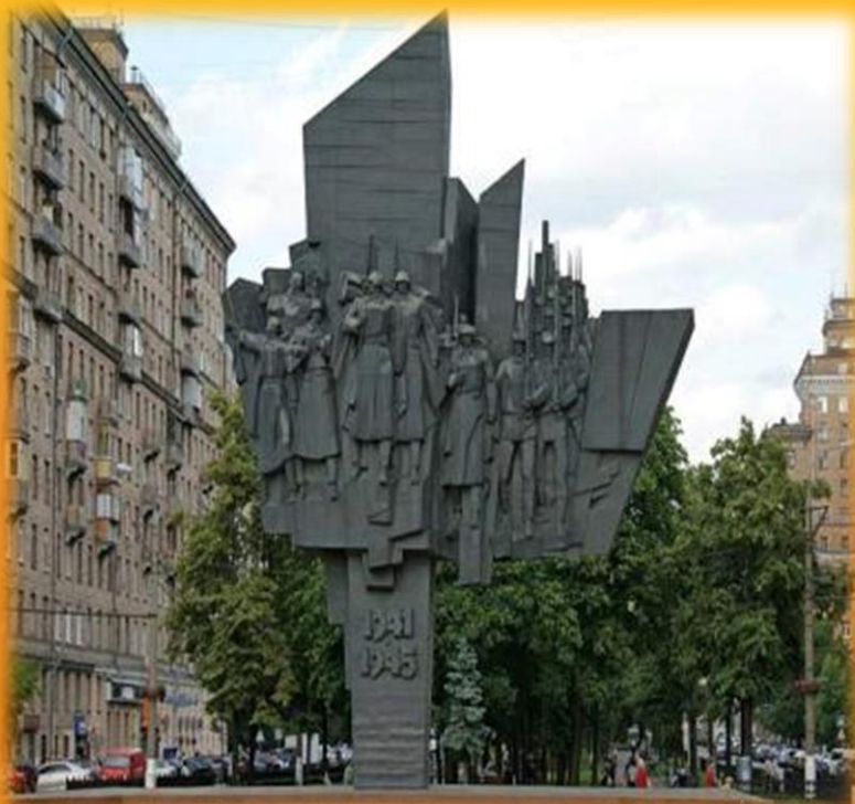
Монумент- «Защитники Москвы»