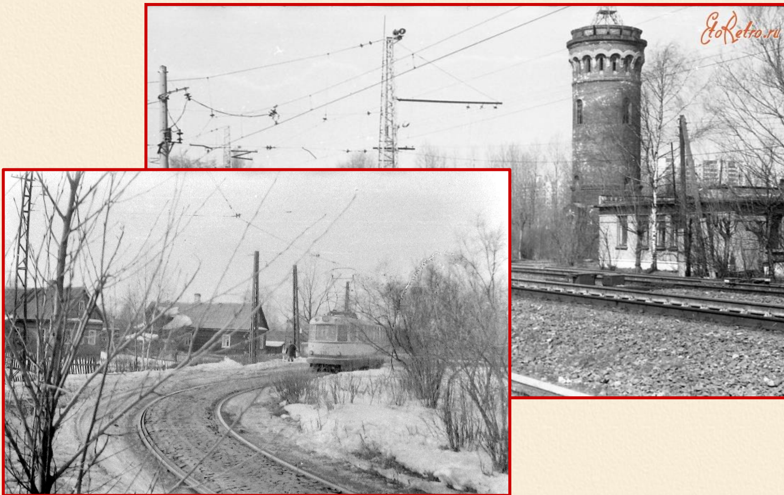
Водонапорная башня и трамвайная линия, запущенная в 1933 году