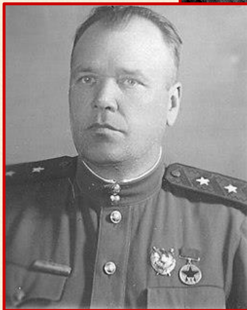
Генерал-лейтенант Лазарев И.Г.