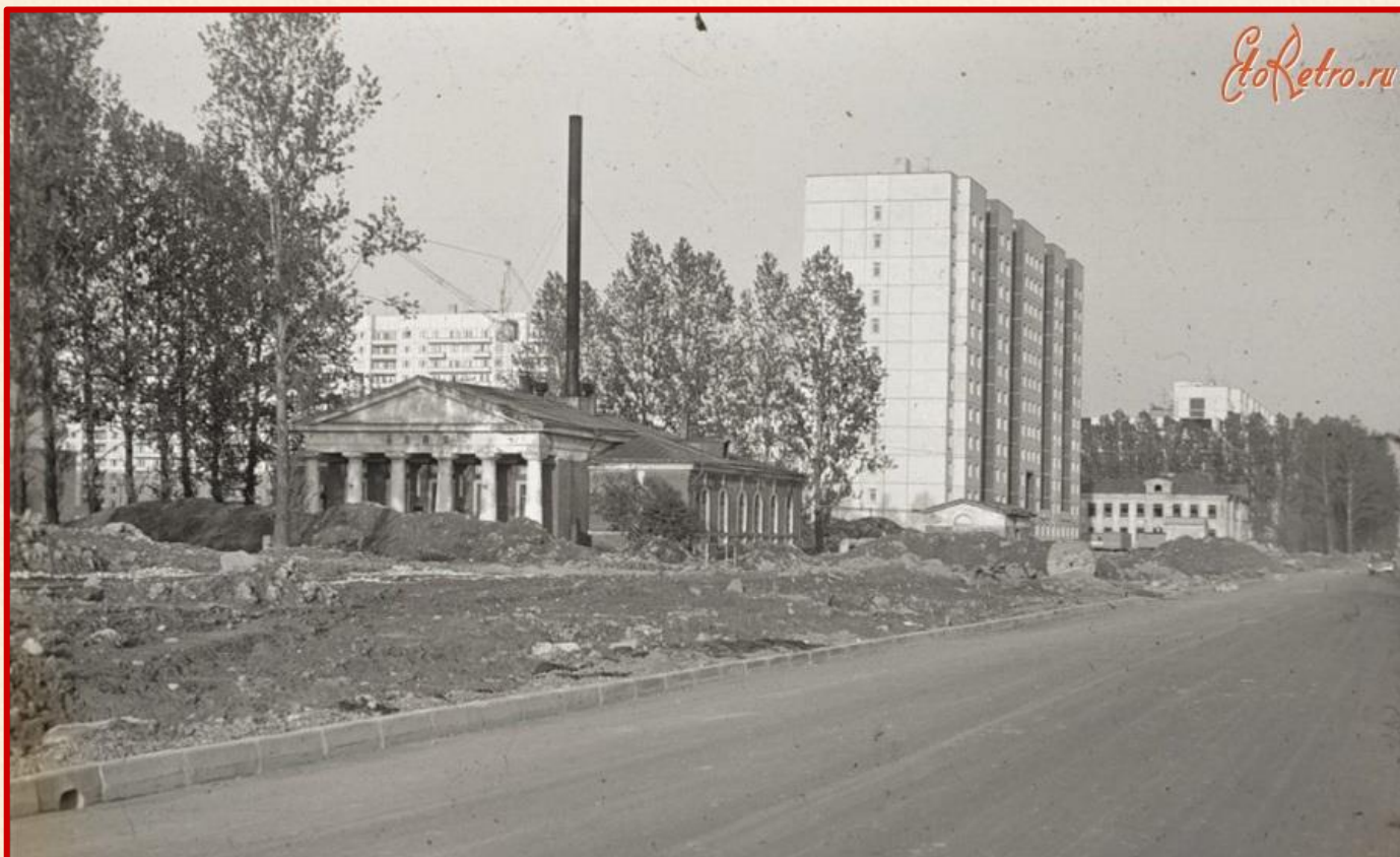
Баня (фото 80-х годов)