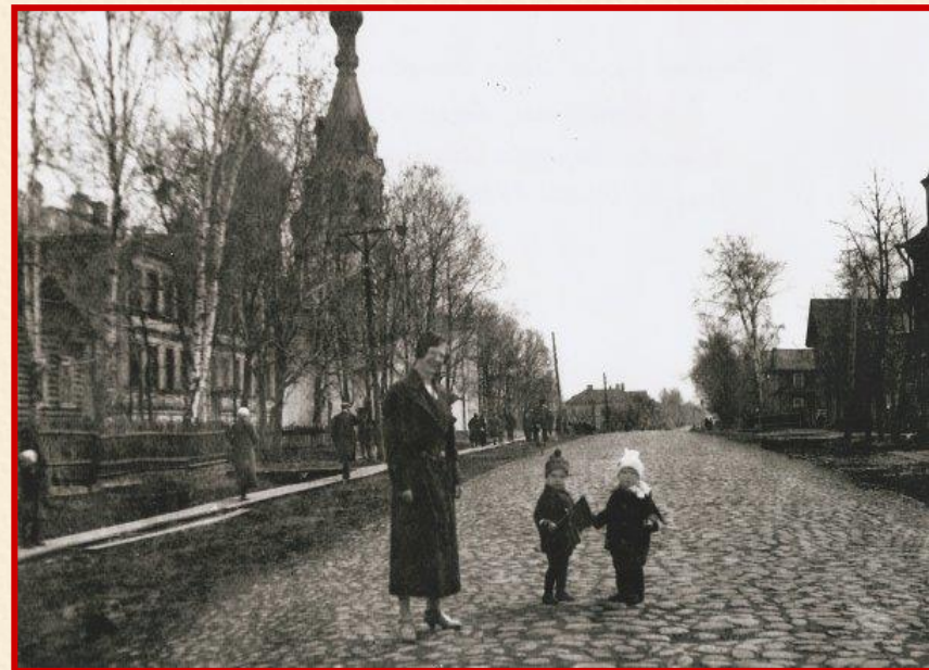
Дом рыбопромышленника Зотова. На Рыбацком проспекте в 30-е годы.