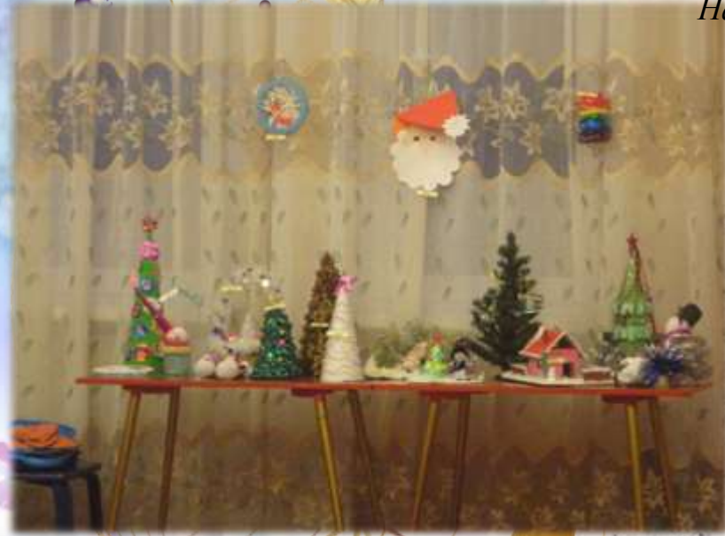
Подарки для Деда Мороза