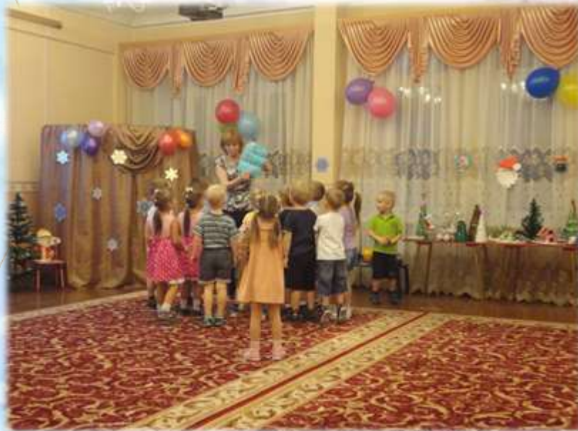
Нашлось наше письмо